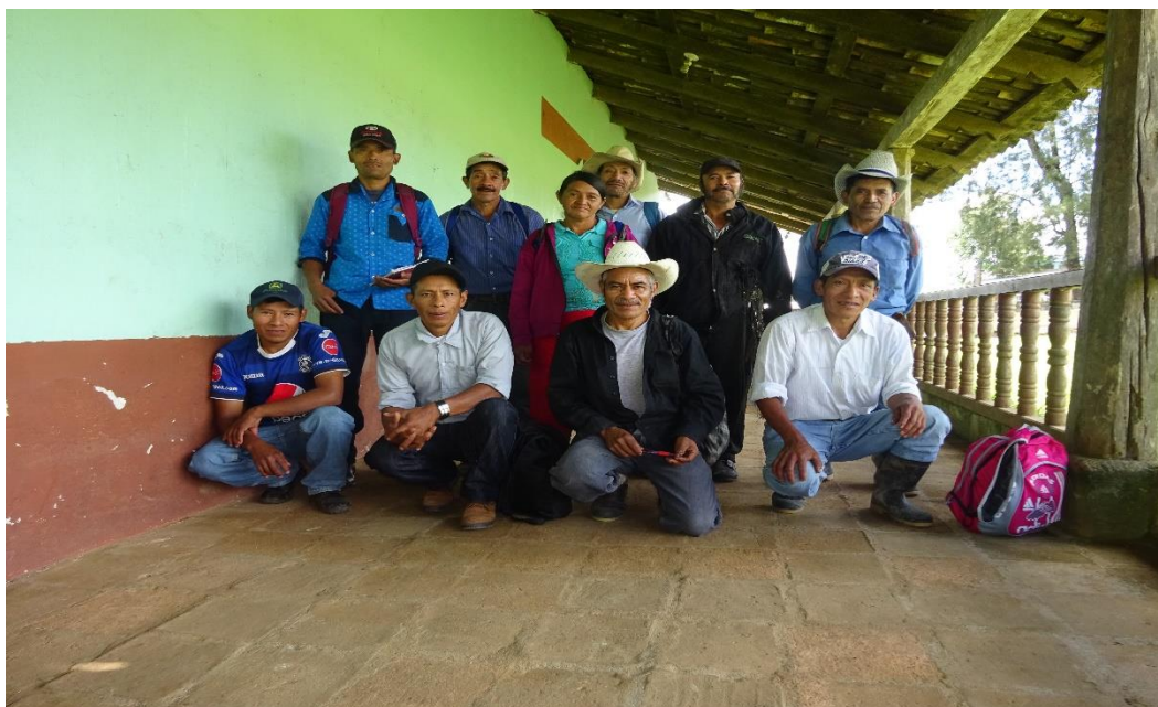
Ilustración 16 Agroecólogos en la jornada de Testimonios

Ahora no hay tantas necesidades, tenemos los ríos y ahora tenemos sistemas de riego. Ya la situación ha cambiado."