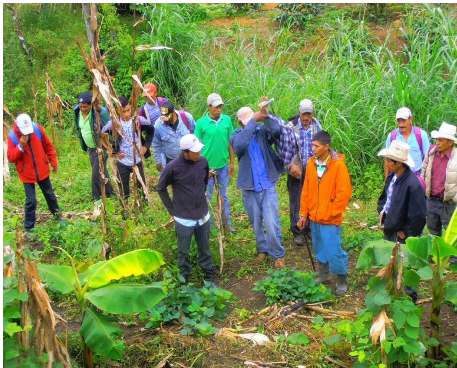
Ilustración 6 Gira de agroécólogos de Santa Elena por el municipio de Chinacla