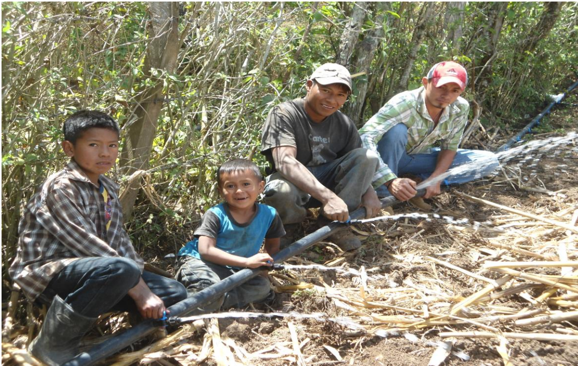
Ilustración 3 Los primeros sistemas de riego en Monte Copado

Este proyecto, que se ejecutó en coordinación con la organización indígena MILPAH, también incorporó la sustitución de insumos orgánicos en lugar de los químicos convencionalmente utilizados, por otra parte se brindaron capacitaciones en formas novedosas de agricultura ecológica, mismas que en algunos casos eran similares a las prácticas indígenas.