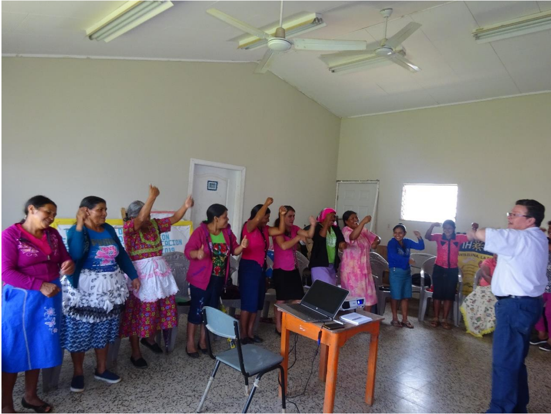
Ilustración 18 Mujeres agroecólogas de MILPAH en jornada de evaluación y testimonios

para la verdura, pero ahora sí, solo se trata de sembrar.