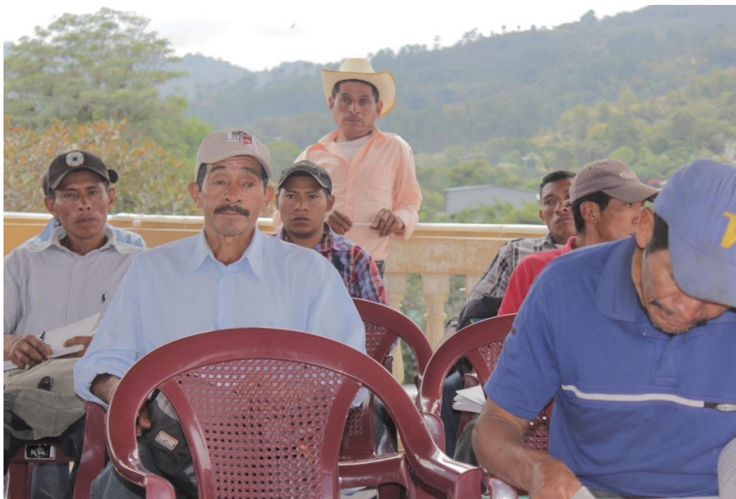
Ilustración 2 Agroecólogos del 2015, Marcala, La Paz

La primera intervención del consorcio MILPAH-CEHPRODEC-Manos Unidas se realiza en el periodo julio de 2013 y septiembre de 2014, se implementan 18 fincas, 6 fincas completas y 12 para agro ecólogos que en ese momento se llaman secundarios.