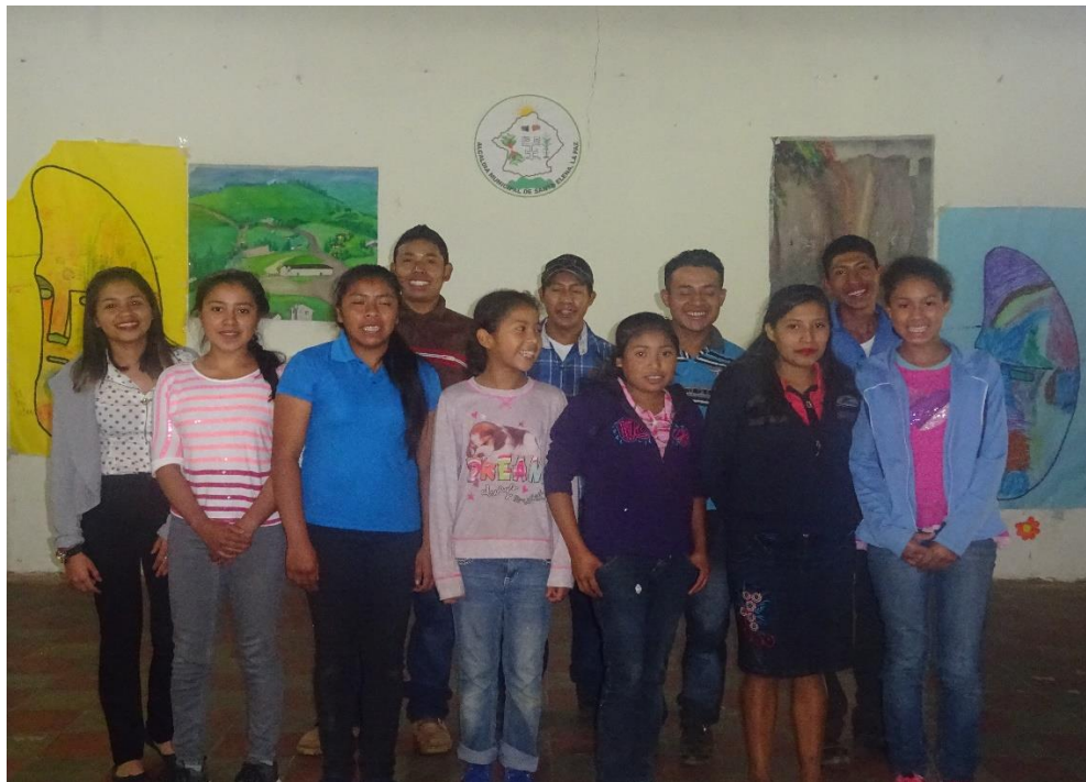
Ilustración 17 Jóvenes agroecólogos de MILPAH

Aquí hicimos una comparación del pasado y presente, que en el pasado solo se cultivaba lo que era el maíz y el café, que son monocultivos y se abonaba con abono químico que eso daña nuestra salud. En el presente, lo que estamos viviendo ahora, ahí está incluido todo lo que son aves, frutales, plantas medicinales, hortaliza, etc. Aquí ya no se utiliza el abono químico, es el abono orgánico que en los talleres que nos dan se aprende, esto y otras cosas. También los beneficios que trae cultivar con abono orgánico es que no estamos dañando el medio ambiente y el otro es que nuestra salud va a ser mejor, y en cambio, con los químicos nos estamos matando a nosotros mismos.