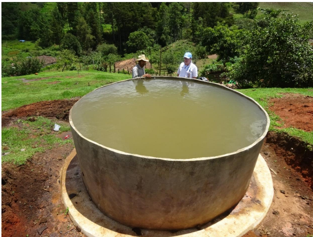
Ilustración 10 Tanque de almacenamiento de agua para fincas, Monte Copado, Santa Elena