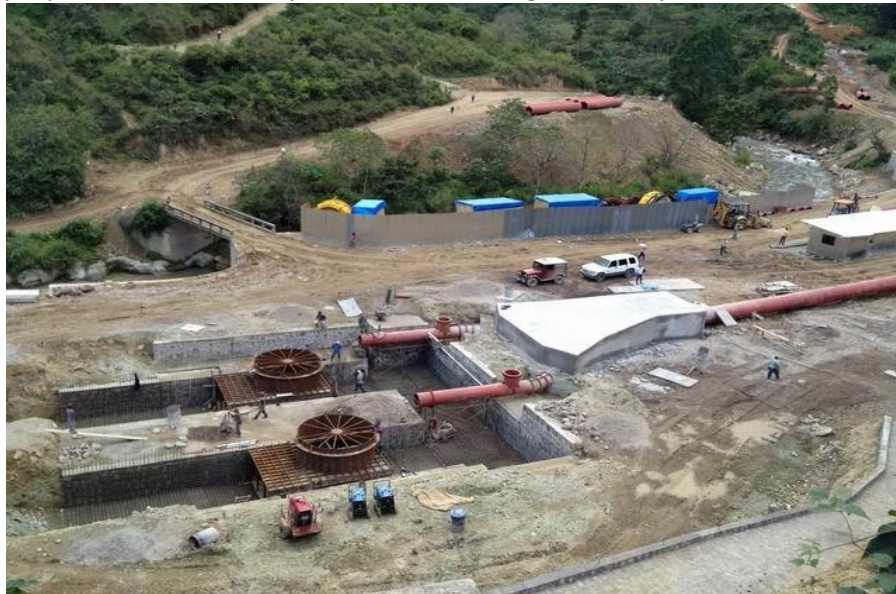
Ilustración 1 Proyecto Hidroeléctrico Aurora I, San José, La Paz

Cuando los dirigentes de MILPAH comenzaron a notar que el proceso para el establecimiento de la hidroeléctrica era inminente, entonces decidieron actuar en varias vías: i, Convocaron a todas las comunidades de Santa Elena, en donde existían consejos indígenas y en donde estas estructuras aun no estaban organizadas, ii, especialmente identificaron las comunidades que podrían ser afectadas por el proyecto hidroeléctrico y fortalecieron su organización y iii, finalmente identificaron otros municipios que