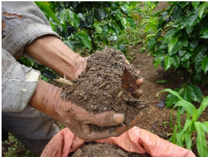
Ilustración 12 La tierra ha mejorado en cada finca