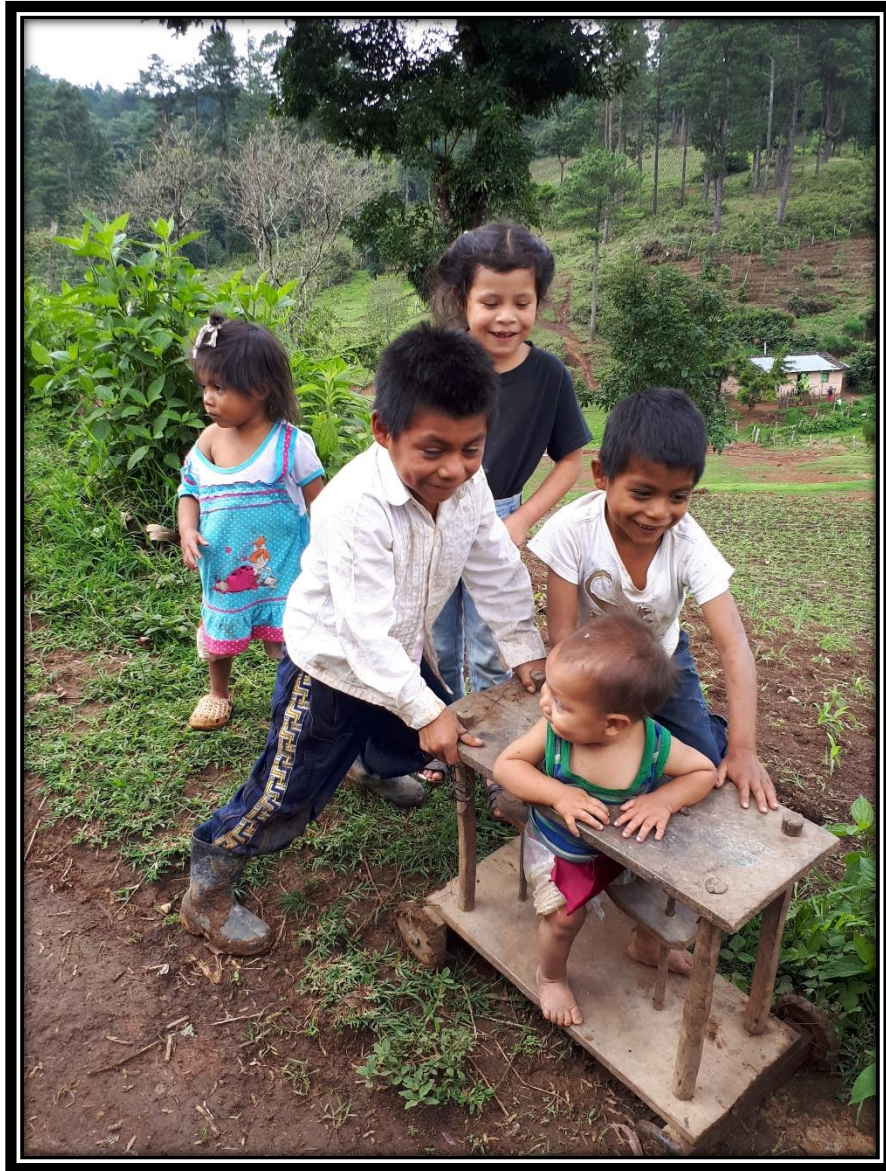
Niñas y niños de la aldea Monte Copado, Santa Elena, La Paz

La experiencia en las fincas indígenas agro ecológicas del MILPAH