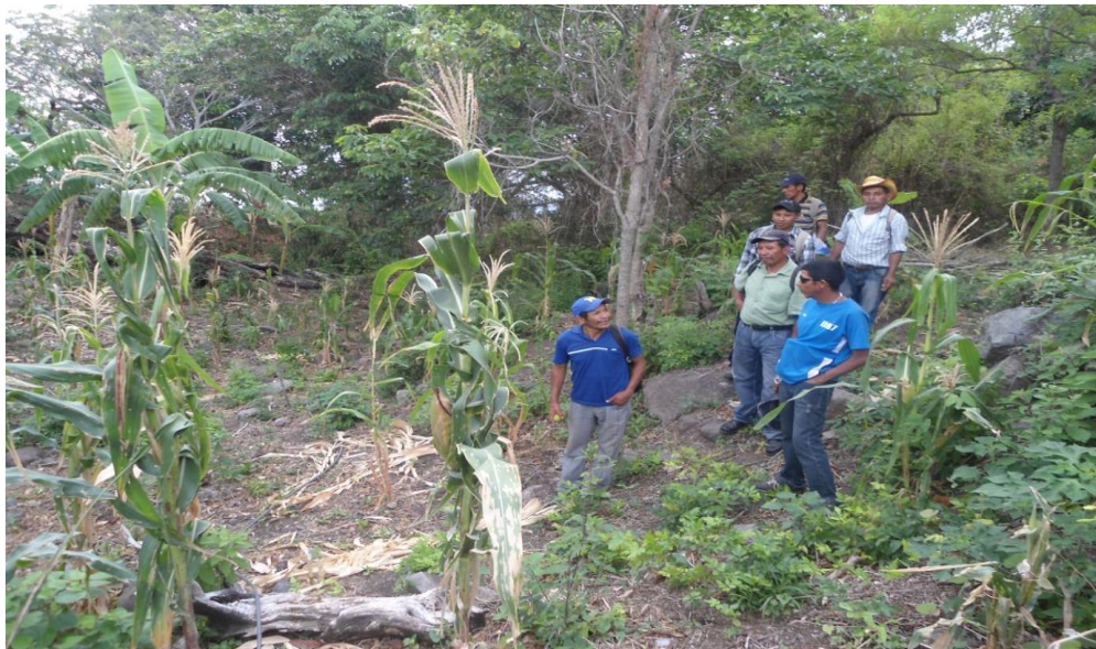
Ilustración 4 Giras de intercambio en San Lucas